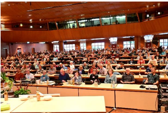
Plenarsitzung Stadthalle Bruchsal

Hier ein Eindruck der Jährlichen Konferenz in Bruchsal und Gemeindetag in Heilbronn